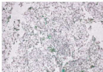
←アマルフィ使用前の写真

【実験方法】 角層チェッカーで、角層細胞の状態をチェックしました。角層細胞のはがれ具合（写真下）と細胞面積から、肌内部に潤いを保つ力を分析します。良い状態の肌は、桜をちらしたようにまんべんなくきれいに角質細胞がはがれます。一方、悪い状態だと、角質細胞が重なるようにごそっとはがれてしまいます。