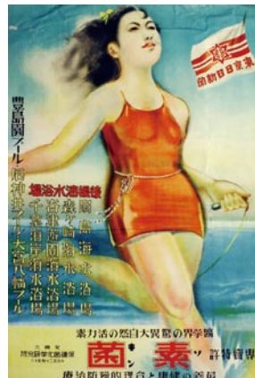
③豊島園プールのPR広告。

スポンサーとして「ソキン」の広告が入っています。