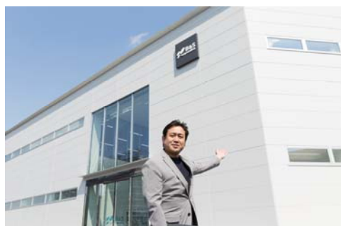
① 「さあ、これからお邪魔しましょう」

『乳酸菌生成エキス』の愛飲者で、当社のイメージキャラクターである俳優の永島敏行さん(60)。NPO 法人レックス・ラボ発行「すこやかメッセージ No.62」の特集ページの依頼を受け、4月に訪問取材いただきました。