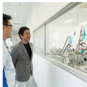
④「へえ〜。脳の健康サプリ『ブルズマローゲン』は、このように抽出されるんですね」

⑤「私は俳優のほかに農業支援や実際に農業にも取り組んでいます。植物に土壌細菌が欠かせないように、ヒトの健康にも有効細菌は欠かせません。そのサポートをする『乳酸菌生成エキス』！ この素晴らしい施設でその研究は進んでいくかと思えます。ぜひ、わかりやすく我々に伝えてくださいね」